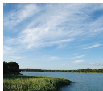
Bassin de Réaltor, près d'Aix-en-Provence