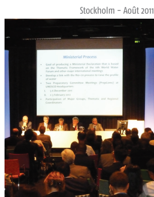
Stockholm – Août 2011