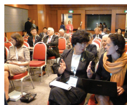
Singapour – Juillet 2011