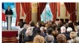
Lancement – Palais de l'Elysée Paris – Juin 2010