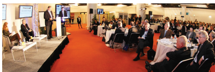
Paris – Janvier 2011