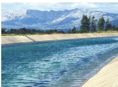
Canal de Provence

Vice-président du Conseil mondial de l'eau