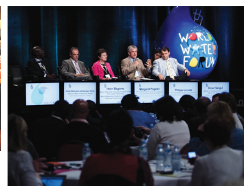
Lyon – Mai 2011