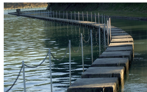
Bassin de décantation de Saint-Christophe