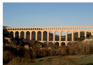
Aqueduc de Roquefavour, transport d'eau de la Durançe jusqu'à Marseille