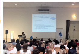
Marseille – Septembre 2011