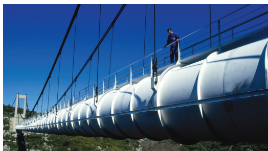
Aqueduc Saint-Bachi, près d'Aix-en-Provence