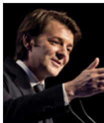
François Baroin, président de l'AMF « Notre modèle économique, vous le savez mieux que quiconque également, Monsieur le

sa mobilisation pour la compensation intégrale des nouvelles charges transférées telles que la mise en œuvre de la réforme des rythmes scolaires. Elle continuera à porter, avec détermination, les fortes attentes des maires de France et des présidents d'intercommunalité.