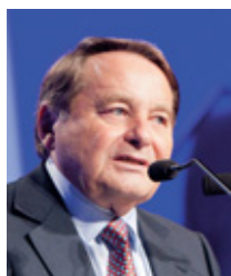
André Laignel, premier vice-président délégué de l'AMF « Assez de caricature ! Je le dis à toutes et à tous – pas à vous, les élus,

Président de la République, repose sur deux moteurs essentiels : la consommation, d'une part, et l'investissement, d'autre part. [...] Avec les départements et les régions de France, nous portons 70 % de l'investissement public. C'est le seul moteur sur lequel la puissance publique peut avoir un élément d'impulsion qui permette de soutenir la croissance et la création d'emplois. À l'intérieur de ces 70 %, 60 % de l'investissement sont portés par les communes et par les intercommunalités et c'est justement à ceux-là que vous demandez 60 % de l'effort. [...] Dans ce contexte, sauvez les investissements publics, Monsieur le Président de la République, aidez-nous, l'année prochaine, à être aux côtés de la croissance économique de notre pays ! »