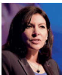
Anne Hidalgo, maire de Paris « Nous devons être unis, comme nous le sommes, dans la candidature aux Jeux olympiques et paralympiques de Paris

[...] Le fonds exceptionnel d'un milliard d'euros pour l'investissement, créé cette année, sera non seulement reconduit l'année prochaine, mais porté à 1,2 milliard d'euros car c'est maintenant qu'il faut investir. »