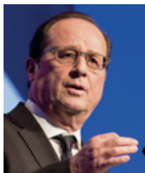
François Hollande, Président de la République « Je connais assez, d'expérience, l'importance des services publics locaux pour

mais à ceux qui en sont souvent les commentateurs – la commune est l'échelon qui s'est le plus transformé : par l'intercommunalité, que nous avons portée, par la commune nouvelle qui, aujourd'hui, a beaucoup de succès et à juste titre. La commune est un lieu de modernité et d'innovation ; il ne se passe pas de semaine sans que nous ne soyons aux manettes en train d'essayer d'innover pour répondre à une anxiété, à une nécessité, au futur. C'est un lieu de création continue, de solidarité et de citoyenneté en action. »