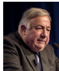
Gérard Larcher, président du Sénat « Oui, faisons confiance aux élus pour adapter les dispositifs nationaux aux besoins locaux.

spécificités et je comprends tout à fait que la République veuille organiser son territoire de la façon qui lui semble appropriée. C'est une question dont l'Europe n'a pas à connaître. [...] L'Europe doit rester l'Europe et la France doit rester la France. Je le dis notamment en relation avec les marchés publics et avec l'universalité du service public qui, oui, est une spécialité française mais qui est aussi un souci que doivent avoir à cœur de prendre en compte ceux qui négocient le Traité transatlantique avec les États-Unis. »