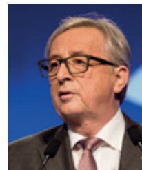
Jean-Claude Juncker, président de la Commission européenne « Je connais la France, je connais ses plis, je connais ses

2024 [...] Nous allons pouvoir créer un mouvement extraordinaire avec cette candidature aux Jeux olympiques et paralympiques. Toutes nos villes, nos communes, nos métropoles vont être impactées positivement par cela. [...] Je crois que, toutes et tous, nous bénéficierons de cette énergie déployée dans cette belle aventure. Nos villes, nos communes, nos métropoles jouent un rôle de proximité, mais elles jouent aussi un rôle de stratégie. Elles représentent l'avenir, un formidable creuset de compétences, de savoir-faire et de talents. »