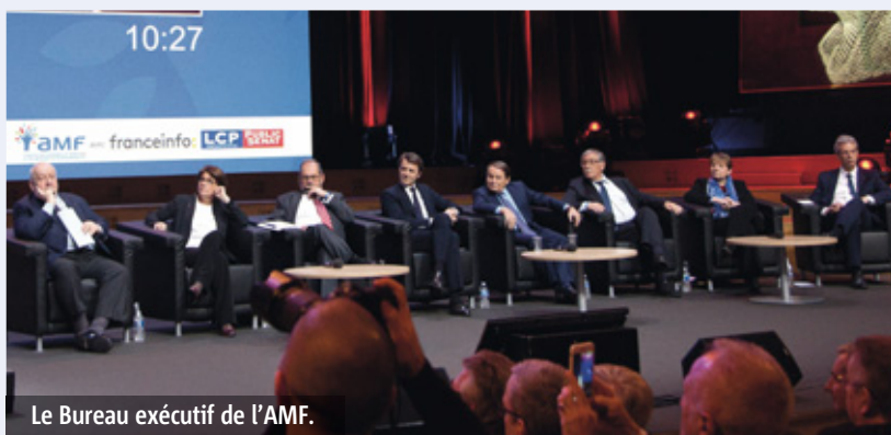
Le Bureau exécutif de l'AMF.