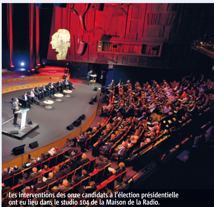
Les interventions des onze candidats à l'élection présidentielle ont eu lieu dans le studio 104 de la Maison de la Radio.