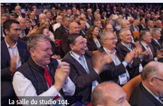
La salle du studio 104.