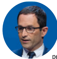
Benoît Hamon (Parti socialiste)

« Je suis favorable au maintien du régime actuel de l'élection des conseillers communautaires dans le cadre des élections municipales sur la base du fléchage. En revanche, la question se pose de façon différente pour les métropoles. L'élection des conseillers métropolitains est plus complexe et il faut faire du cas par cas. »