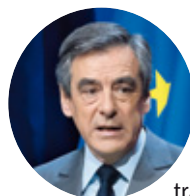
François Fillon (Les Républicains)

« J'abrogerai la loi NOTRe pour réhabiliter la commune et la fierté d'être maire. (...) Je ne veux pas de ces grandes intercommunalités. J'ai beaucoup aimé la première génération de communautés de communes qui étaient des outils au service des communes. »