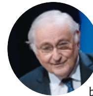
Jacques Cheminade (Solidarité et progrès)

« J'ai acquis la conviction que rien n'est possible dans cette période difficile sans les communes, qu'il s'agisse de l'accueil des réfugiés ou de la réussite de la transition écologique (...) Il faut mettre fin au désenchantement actuel qui se nourrit notamment d'une baisse des services publics de plus en plus mal vécue dans les territoires. »