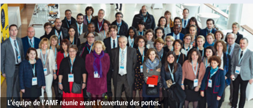
L'équipe de l'AMF réunie avant l'ouverture des portes.