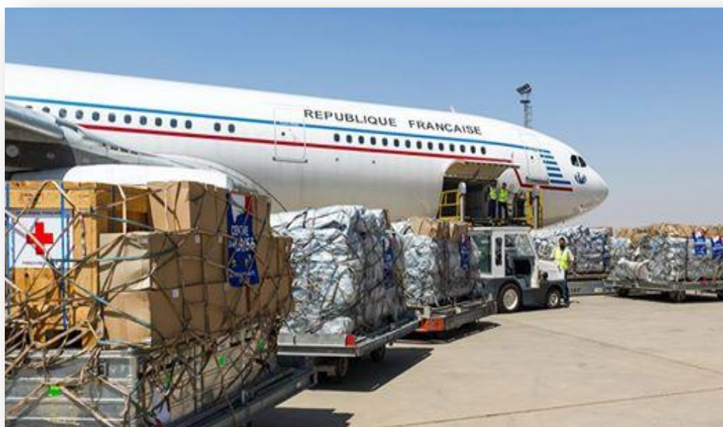
Premier vol humanitaire du ministère des Affaires étrangères et du Développement international, 10 août 2014.

Chiites 60-65 %, Sunnites 37-32 %, christianisme, yézidisme, mandéisme et sabéisme 3%.