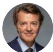
François Baroin / Président de l'AMF, Maire de Troyes