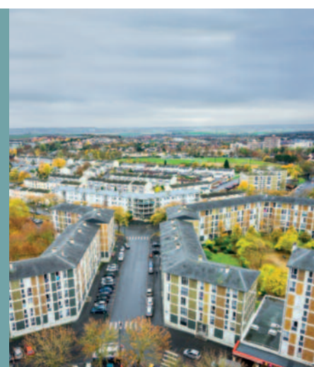
Couverture : © C. Beudot

Les élus veulent conserver leurs compétences dans les politiques de l'habitat pour mener à bien leurs projets. Les outils existent.