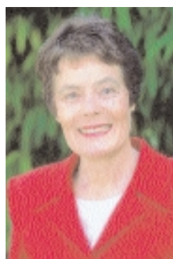
19 Marie-Thérèse Boisseau

En prélude à l'année européenne du handicap, la secrétaire d'État aux Personnes handicapées dresse un rapide bilan de la situation et évoque ses projets. La loi en préparation doit déboucher sur des mesures qui aident à compenser le handicap mais, souligne-t-elle, la réponse aux problèmes ne doit pas se chercher uniquement en termes d'argent. La ministre compte sur le soutien des maires pour faire évoluer les mentalités.