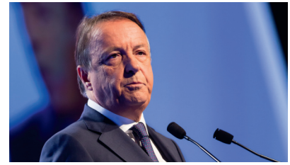
Jean-Pierre Bel, président du Sénat

[...] La fracture territoriale est plus que jamais une réalité. Une attention toute particulière doit être portée aux territoires ruraux et péri-urbains. Loin d'être les laissés-pour-compte de la concentration urbaine, ils doivent voir leurs spécificités reconnues et mises en valeur. Ils sont porteurs de savoir-faire et de ressources qui ne sauraient être laissés en jachère. [...] Connectées au réseau des villes du monde, les grandes métropoles sont une chance pour la France. Mais prétendre faire reposer sur elles seules le développement de notre nation serait une impasse dangereuse, porteuse d'exclusion et de déclassement.