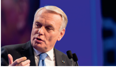
Jean-Marc Ayrault, Premier ministre

Et ce n'est pas un hasard si, parmi tous les mandats, le mandat de maire est le plus apprécié des Françaises et des Français. [...] Et je le rappelle ici aujourd'hui devant vous à ceux qui nous disent que les communes sont dépassées, que 36 000 communes c'est trop, que c'est un handicap pour le pays. Le maire aujourd'hui, et vous le savez mieux que quiconque, c'est celui qui peut aider, c'est le premier élu à qui l'on peut s'adresser, c'est l'élu le plus connu et le recours le plus évident. Et aux yeux de nos concitoyens, et je pense en particulier aux plus modestes, à ceux qui parfois ne savent pas à qui s'adresser, le maire est la démocratie en personne.