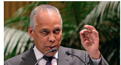
Victorin Lurel, ministre des Outre-mer

[...] La fracture territoriale est plus que jamais une réalité. Une attention toute particulière doit être portée aux territoires ruraux et péri-urbains. Loin d'être les laissés-pour-compte de la concentration urbaine, ils doivent voir leurs spécificités reconnues et mises en valeur. Ils sont porteurs de savoir-faire et de ressources qui ne sauraient être laissés en jachère. [...] Connectées au réseau des villes du monde, les grandes métropoles sont une chance pour la France. Mais prétendre faire reposer sur elles seules le développement de notre nation serait une impasse dangereuse, porteuse d'exclusion et de déclassement.